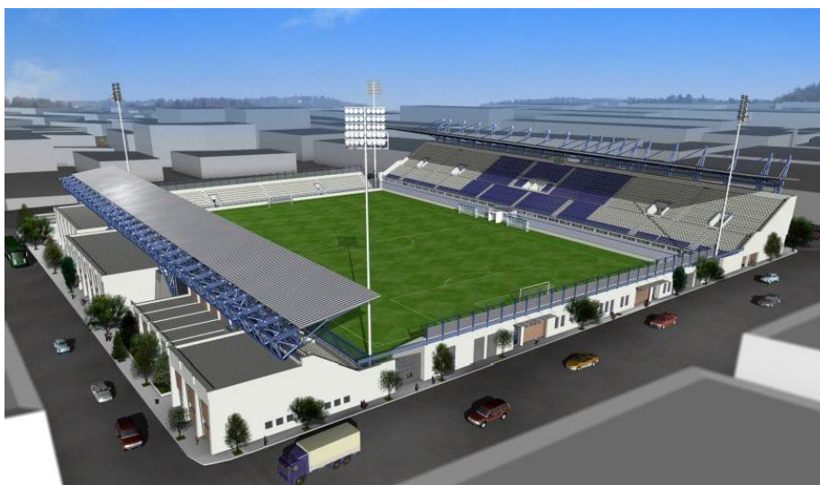
Σχήμα 1: Γενική 3D απεικόνιση δημοτικού σταδίου «Σταύρος Μαυροθαλασσίτης».

Ο Δήμος Αιγάλεω, συμμετέχει στο παραπάνω ερευνητικό έργο με την εγκατάσταση πιλοτικής πλατφόρμας 5G, με έμφαση στην νέα τεχνολογία μικρών κελιών «small cells», στο δημοτικό στάδιο του Αιγάλεω «Σταύρος Μαυροθαλασσίτης» (Σχήματα 1 και 2), για δοκιμές σε μεγάλα γεγονότα με υψηλές απαιτήσεις (flash crowd events). Η τοπολογία του συστήματος σύνδεσης απεικονίζεται στο Σχήμα 3. Επίσης, θα μελετηθεί η αποδοχή της τεχνολογίας από την κοινωνία, κυρίως όσον αφορά τις μεγάλες ταχύτητες πρόσβασης σε διάφορες εφαρμογές (applications), και τη μικρή καθυστέρηση (latency) μετάδοσης των ψηφιακών πληροφοριών.